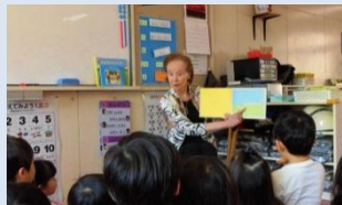
元 NY ドルトン校長による授業