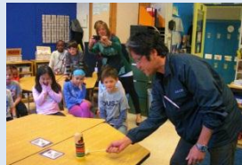
NY ドルトンへ教員派遣