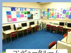
コンピュータールーム

各教室は子どもたちの興味や好奇心をかきたてる遊びのコーナーが魅力的に設置されています。また、体育館や運動場等の運動施設や音楽室やアートルーム、コンピュータールーム等の各専門教室も充実しています。ICT 教育実践のための教育機器も備えています。