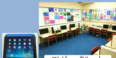
コンピュータールーム

各教室は子どもたちの興味や好奇心をかきたてる遊びのコーナーが魅力的に設置されています。また、体育館や運動場等の運動施設や音楽室やアートルーム、コンピュータールーム等の各専門教室も充実しています。ICT 教育実践のための教育機器も備えています。