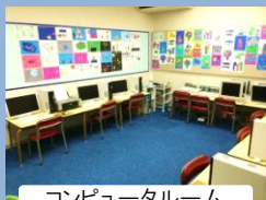
コンピュータールーム

各教室は子どもたちの興味や好奇心をかきたてる遊びのコーナーが魅力的に設置されています。また、体育館や運動場等の運動施設や音楽室やアートルーム、コンピュータールーム等の各専門教室も充実しています。ICT 教育実践のための教育機器も備えています。