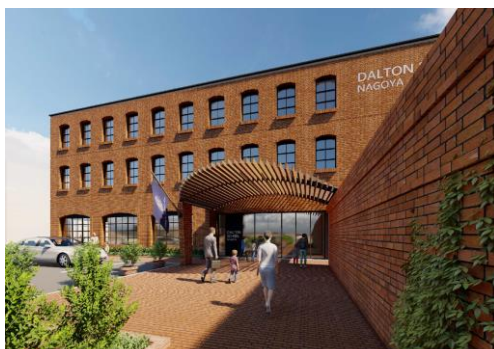
新校舎完成予定図(2024年1月より授業開始予定)