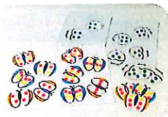
記号 「てんとう虫の評価」